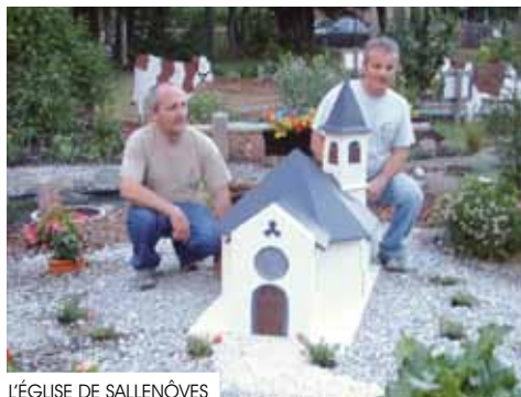
L'ÉGLISE DE SALLENÔVES

En 2012, le Parc ouvrira ses portes le vendredi 11 mai. Les jardiniers seront heureux de vous y accueillir afin de vous faire découvrir les nouveautés et vous faire partager leur savoir-faire.