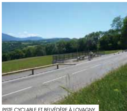
PISTE CYCLABLE ET BELVÈDÈRE À LOVAGNY.

En 2011, la commune de Lovagny a perçu une subvention pour les travaux d'aménagement de la piste cyclable reliant Lovagny à Poisy. La commune de Nonglard a également bénéficié d'une subvention pour la réalisation d'un parking relais.