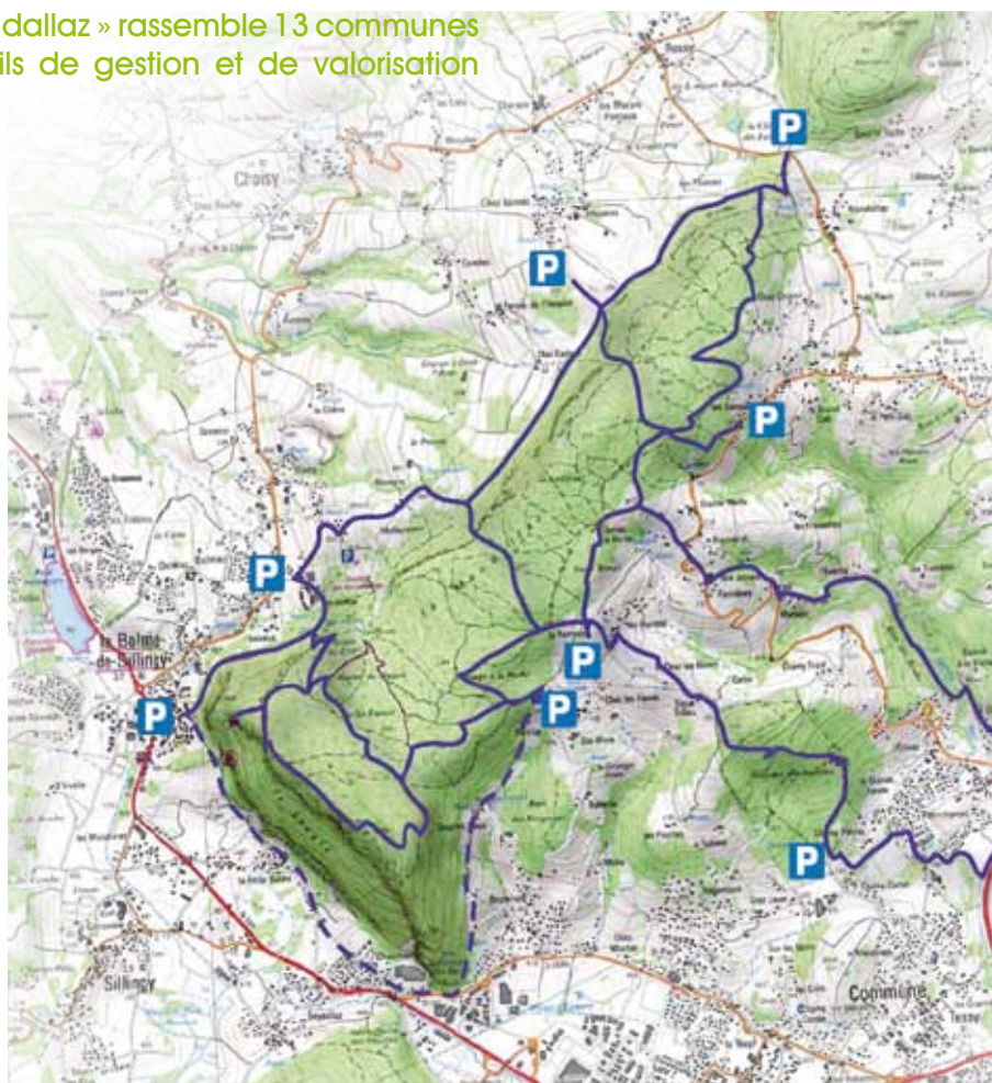
Boucles PDIPR de La Mandallaz

Le balisage des sentiers est le second axe de travail du Comité de Pilotage. 4 boucles sont en cours de balisage sur La Mandallaz. Elles s'intègrent dans le Plan Départemental des Itinéraires de Randonnée Pédestre (PDIPR) par lequel le Conseil Général finance en partie le matériel de balisage. Des équipes de bénévoles des communes de Choisy, La Balme de Sillingy, Epagny, Pringy et Cuvat sillonnent actuellement les sentiers de La Mandallaz afin d'installer la signalisation. Dès ce printemps il sera possible de découvrir les itinéraires. Des panneaux d'accueil indiquant les parcours seront installés aux différentes entrées. Le balisage des sentiers de la Montagne d'Age est en phase d'étude.