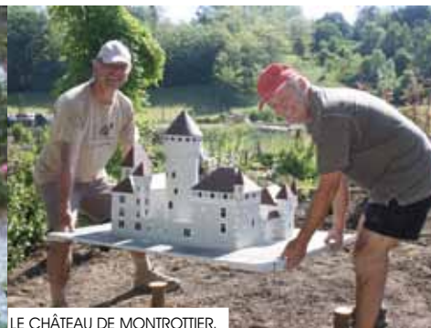
LE CHÂTEAU DE MONTROTTIER.